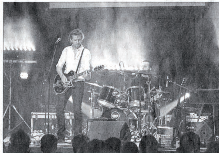
Enfant du Peuchapatte, Zédrus en pleine action avec son batteur.

appartient à Fox, le présentateur: «J'ai piraté Johnny mais je n'ai pas eu l'impression de le voler».