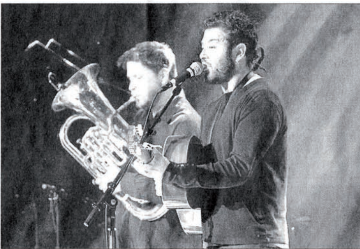
Chouf ou l'art de créer une ambiance festive avec de bons textes.