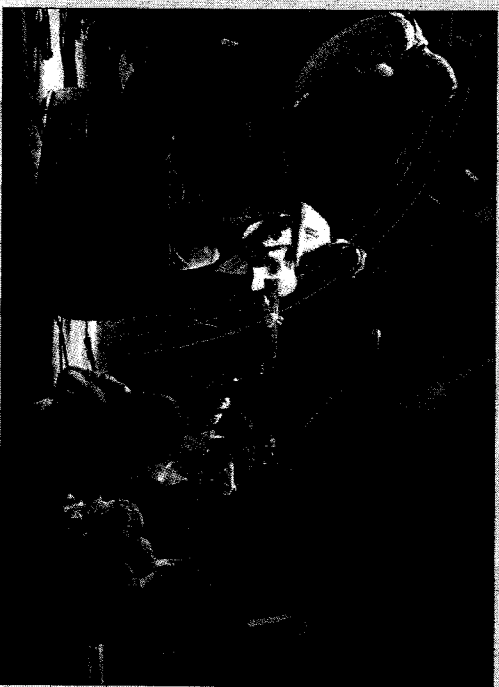
Govrache, tendre et nostalgique, a remporté le prix du public.