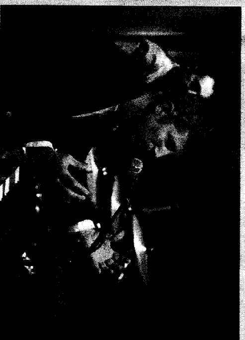
Askheoug, irrésistible dandy moustachu.